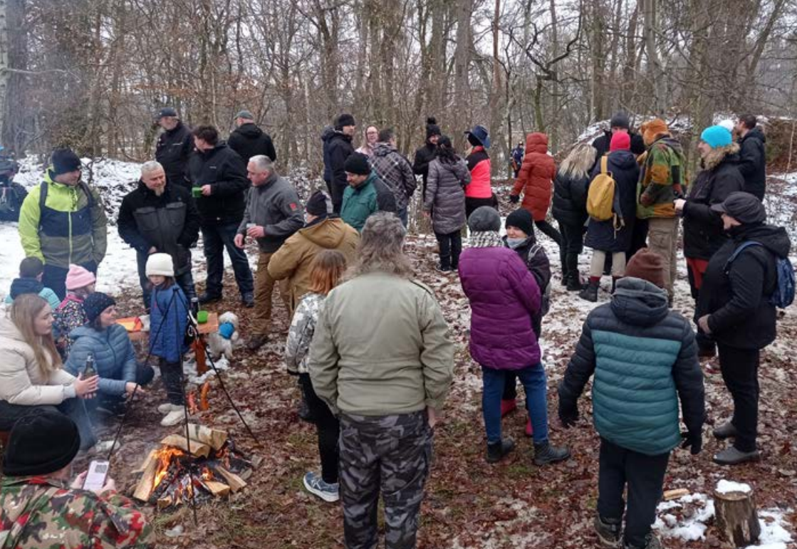
Zlatokopecký den 2026