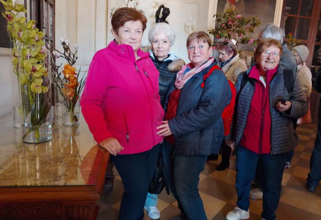
Za krásou kamélií v Rájci nad Svitavou