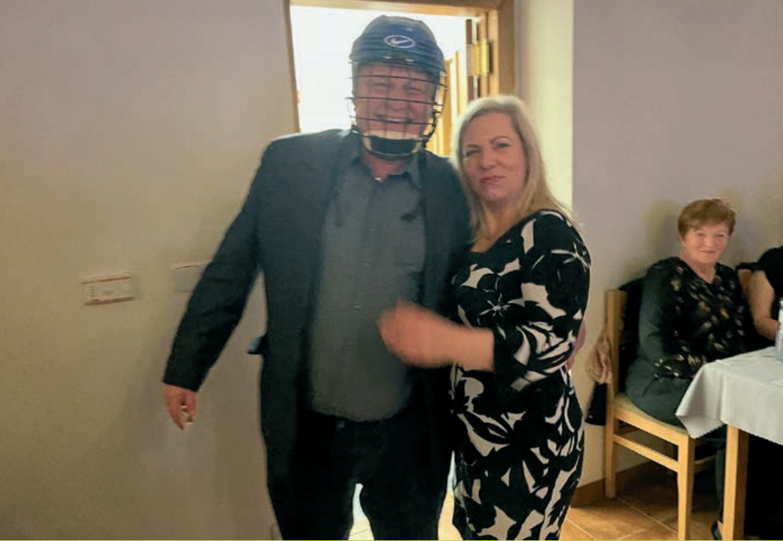
Fotostřípky z obecního plesu 2026