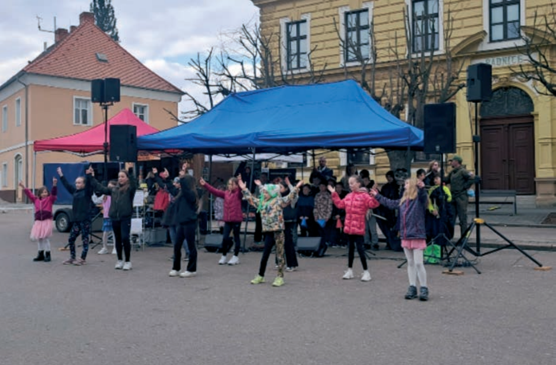
Naše vystoupení na Jarohrátkách v Přebouči