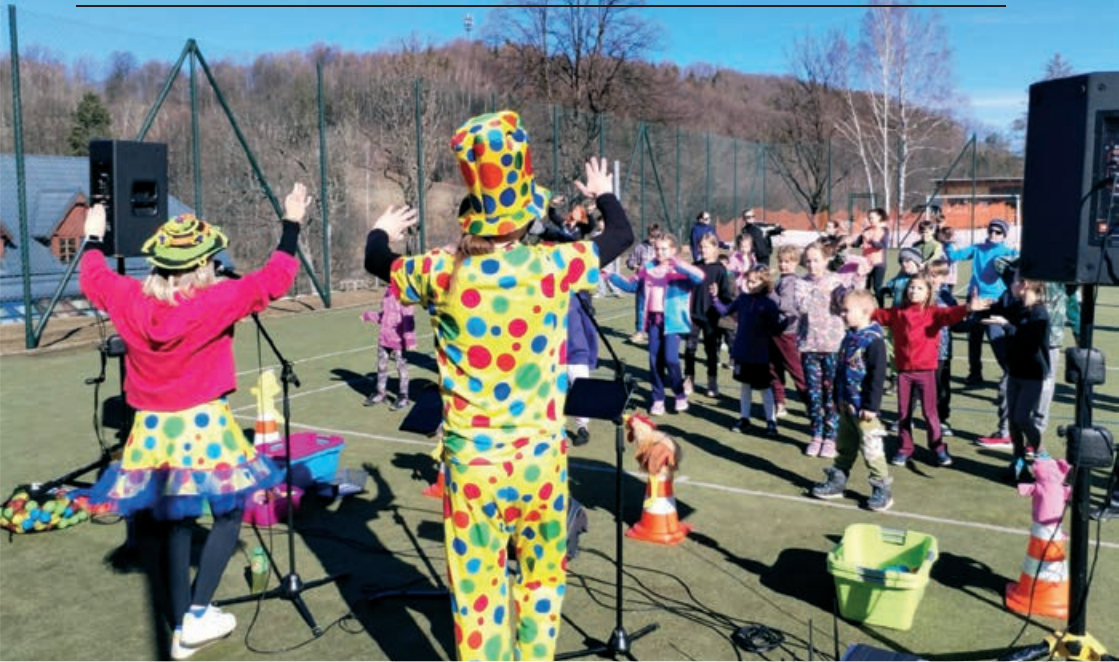
Začátkem března jsme pořádali pro své žáky tradiční Zimní ozdravný pobyt.