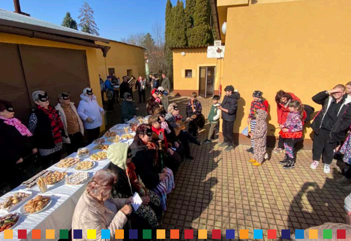
Fotoreportáž: Zdechovický masopust 2026