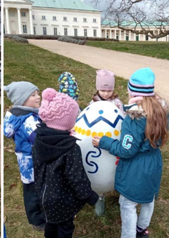
Jaro v mateřské školce...