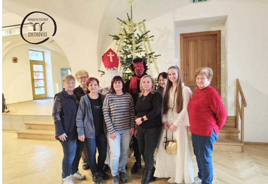
Klub žen...Mikulášská nadílka