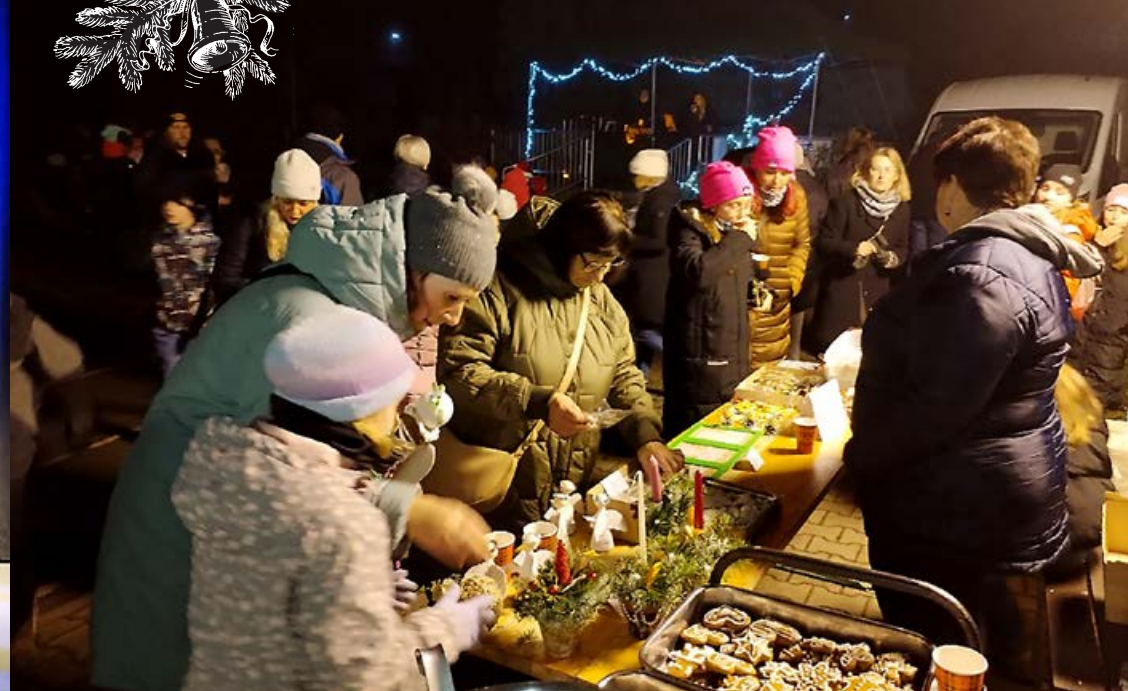
Betlémské zpívání ▲