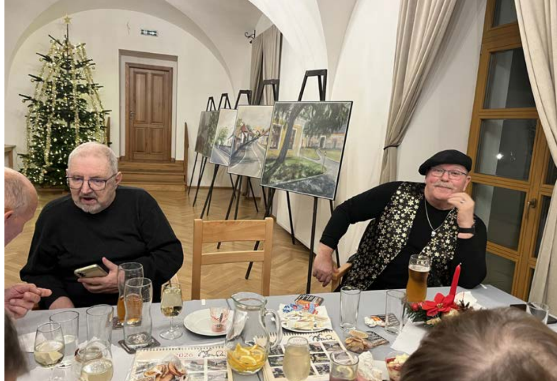
Den úcty ke stáří