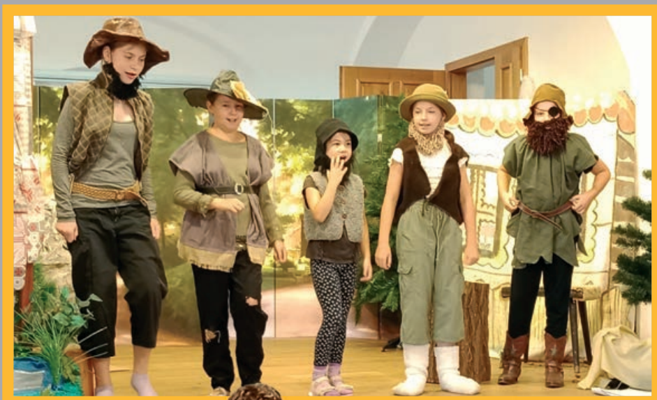
Divadelní představení „Mrazík“