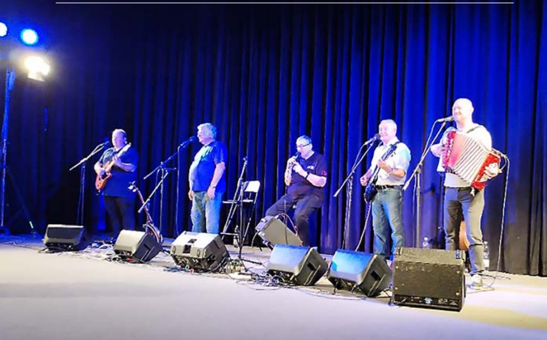
Děti rozdávají aneb Bejvávalo, bejvávalo – společný koncert žáků a skupiny Lokálka