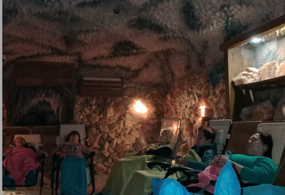
Solná jeskyně v Třemošnici ▲