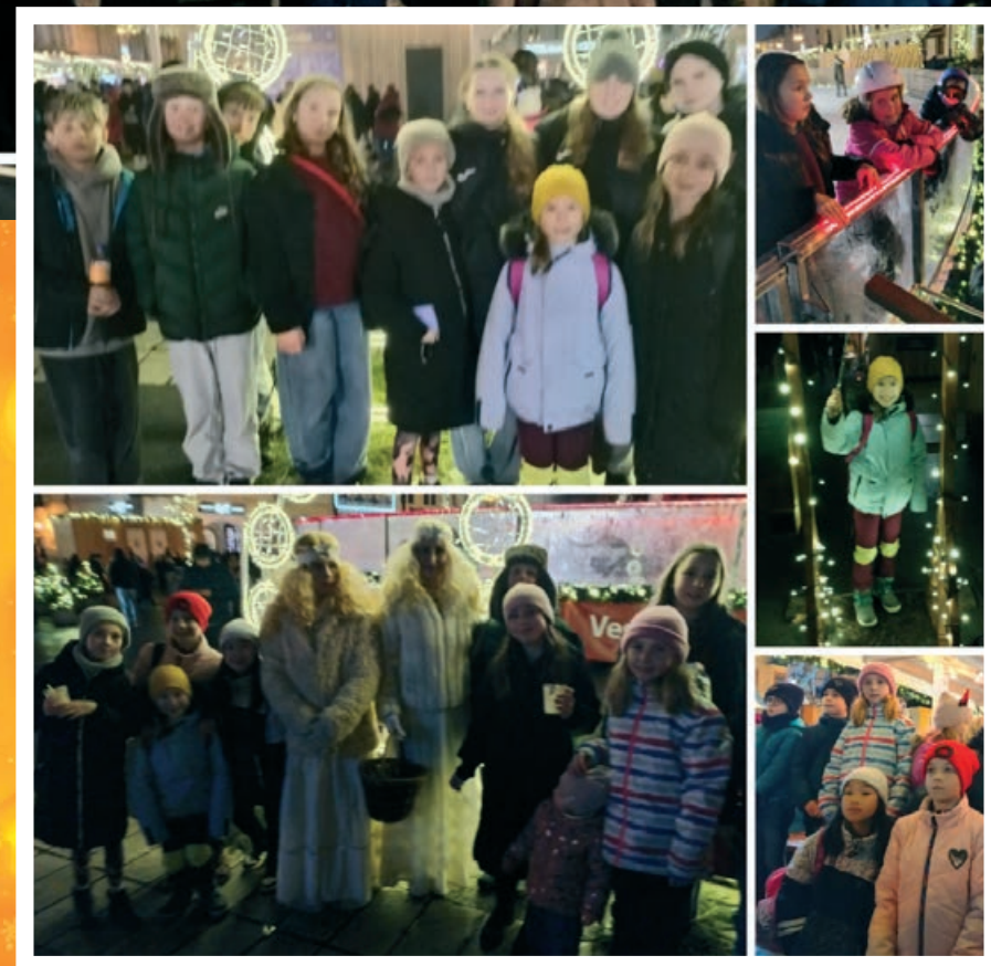
▲ Rozsvěcení vánočního stromu v Morašicích