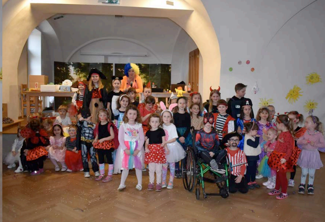
Fotoreportáž: Dětský karneval