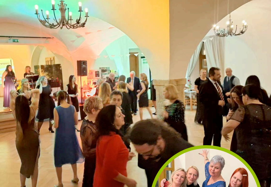
Fotoreportáž: Obecní ples 2025