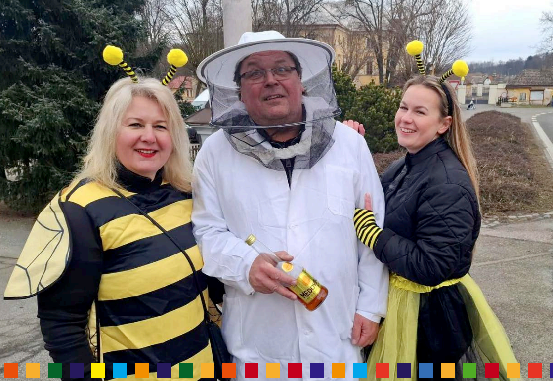
Fotoreportáž: Zdechovický masopust 2025