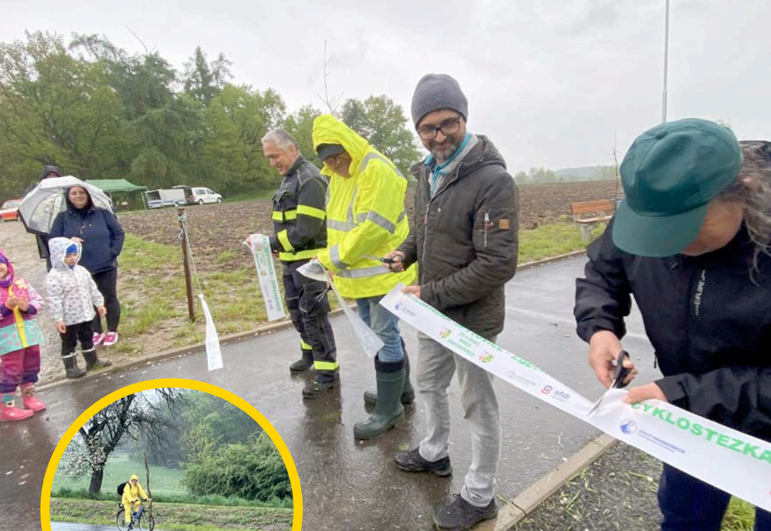
Fotoreportáž: Slavnostní otevření cyklostezky Zdechov